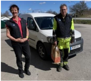
Hemkörning av varor i mars 2020

2020 blev det år en pandemi svepte in över oss. Pandemin orsakade stora konsekvenser för människors hälsa och ekonomi världen över. Men vi har inte suttit och deppat utan försökt att hitta nya lösningar för att komma framåt! Styrelsemöten hölls utomhus eller via Skype och vi kontaktade olika medlemmar och parter i bygden hur vi kunde lösa några praktiska problem. Tillsammans med ICA Nära i Bräkne Hoby och deltagare ur vårt arbetslag påbörjade vi hemkörning av mat/varor i mars. Leveransen blev mycket uppskattad. Samtidigt utvecklade vi anpassade aktiviteter inom restriktionerna som gällde under året. Här nedan kan du läsa mer om aktivitetsgrupperns verksamheter!